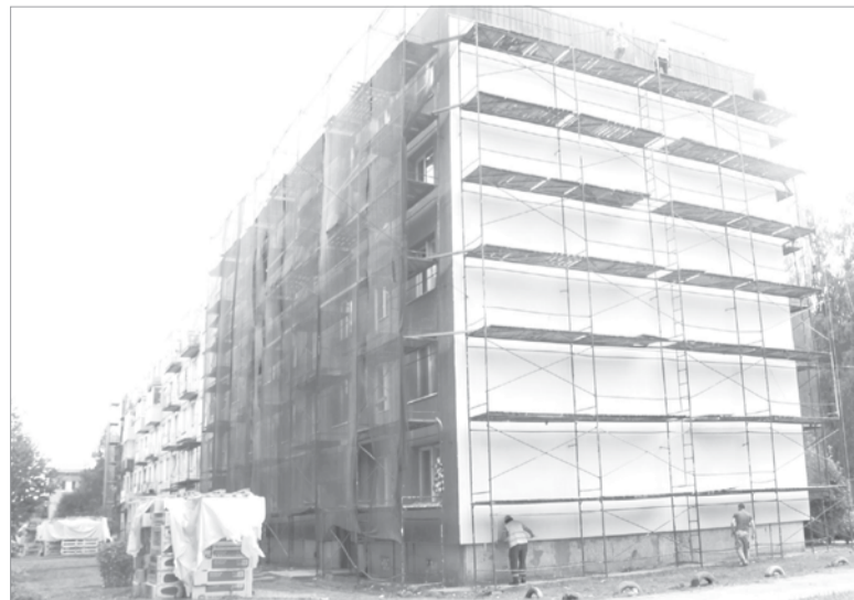
В доме № 9 на ул. Талалихина ремонтируют и утепляют фасад

НА 32 ДОМАХ В ГОРОДЕ ПРОИЗВОДИТСЯ 41 ВИД РАБОТ НА ОБЩУЮ СУММУ ПОРЯДКА 474 МИЛЛИОНА РУБЛЕЙ, ИХ НИХ 28 ФАСАДОВ, 7 КРЫШ, 2 ИНЖЕНЕРНЫЕ СЕТИ – ТЕПЛОСНАБЖЕНИЯ И ВОДООТВЕДЕНИЯ.