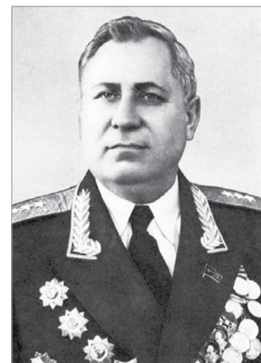
Организаторы и вдохновители создания мемориала «Свирская Победа»: маршал Советского Союза К.А.Мерецков и член Военного совета Карельского фронта Т.Ф.Штыков