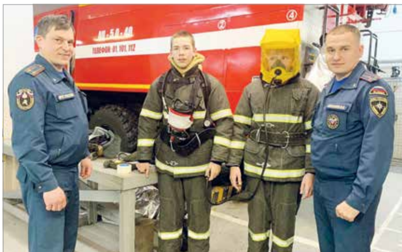
Занятия с юными пожарными

ЖИЗНЬ ПОСЛЕ КОРОНАВИРУСА Расскажем, как восстанавливать здоровье после этого опасного заболевания.