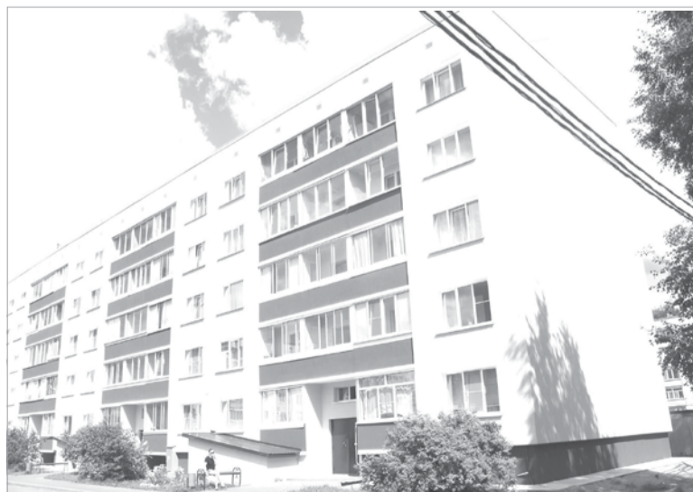
В доме № 13 (корп. 2) на ул. Пограничной ремонт фасада завершён