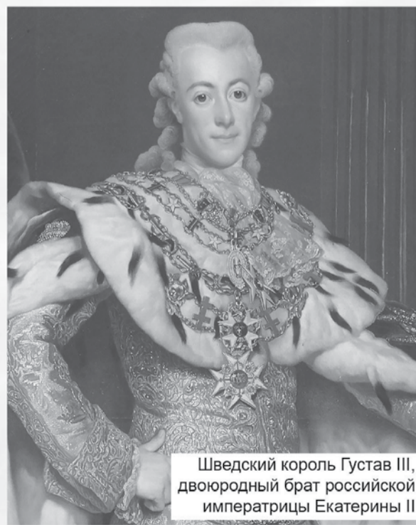
Шведский король Густав III, двоюродный брат российской императрицы Екатерины II

гребной флот, усиленный у Тверминне вновь построенными судами, 12 июня соединился у острова Соттунга с гребными судами Кейта и направился к берегам Швеции для высадки десанта. Но 18 июня было получено известие о том, что 16 июня в