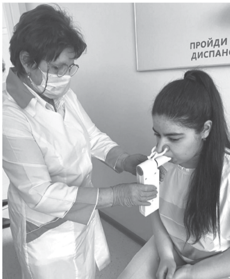
Спирометрия позволяет оценить состояние лёгких после коронавируса

– А как обстоят дела с диспансеризацией? Она ведь особенно важна для перенесших COVID-19?