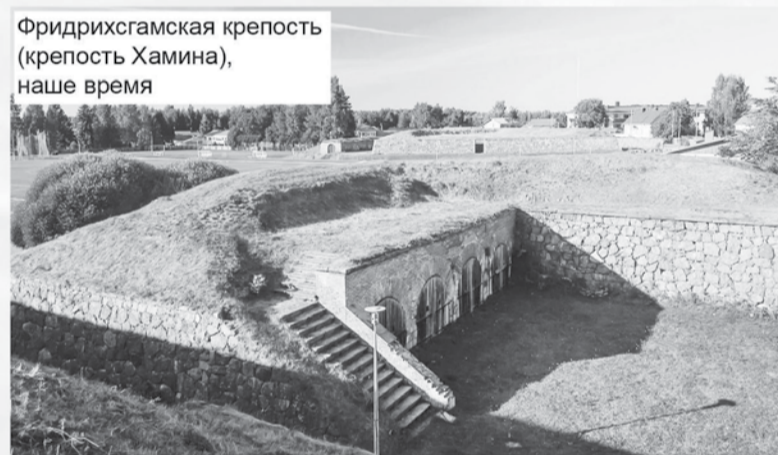
Фридрихсгамская крепость (крепость Хамина), наше время