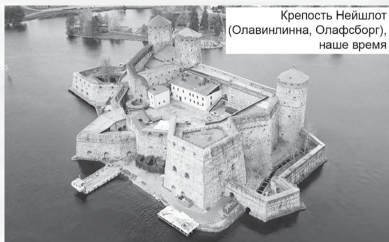
Крепость Нейшлот (Олафинлинна, Олафсборг), наше время

Шведские войска в Финляндии с конца июня 1788 года стояли под крепостью Нейшлот и вдоль реки Кюммене. В июле они начали наступление тремя колоннами: от Санкт-Микеля на Вильманстранд, от Кельтиса на Давыдов и от Абборфорса на Фридрихсгам.